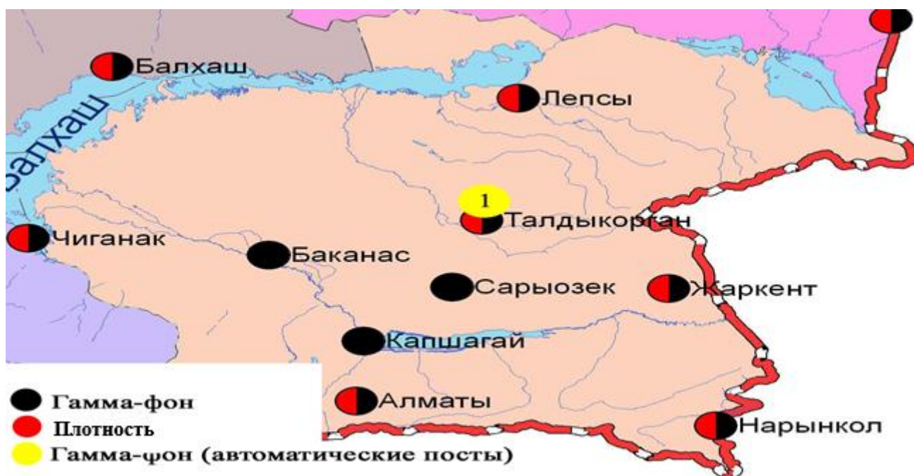
Рис. 2 - Схема расположения метеостанций по наблюдениям уровня радиационного гамма-фона и плотности радиоактивных выпадений на территории Алматинской области