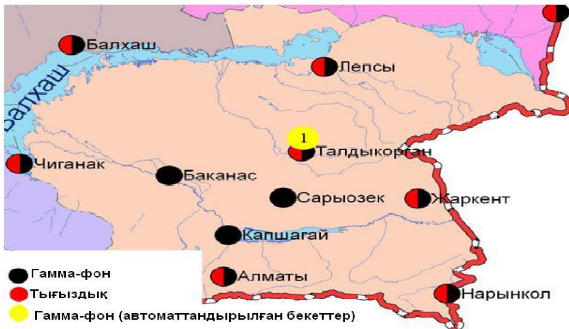
Алматы облысының аумағындағы радиациялық гамма-фон мен радиоактивті түсулердің тығыздығын бақылау метеостансаларының орналасу сызбасы. Сурет-3.