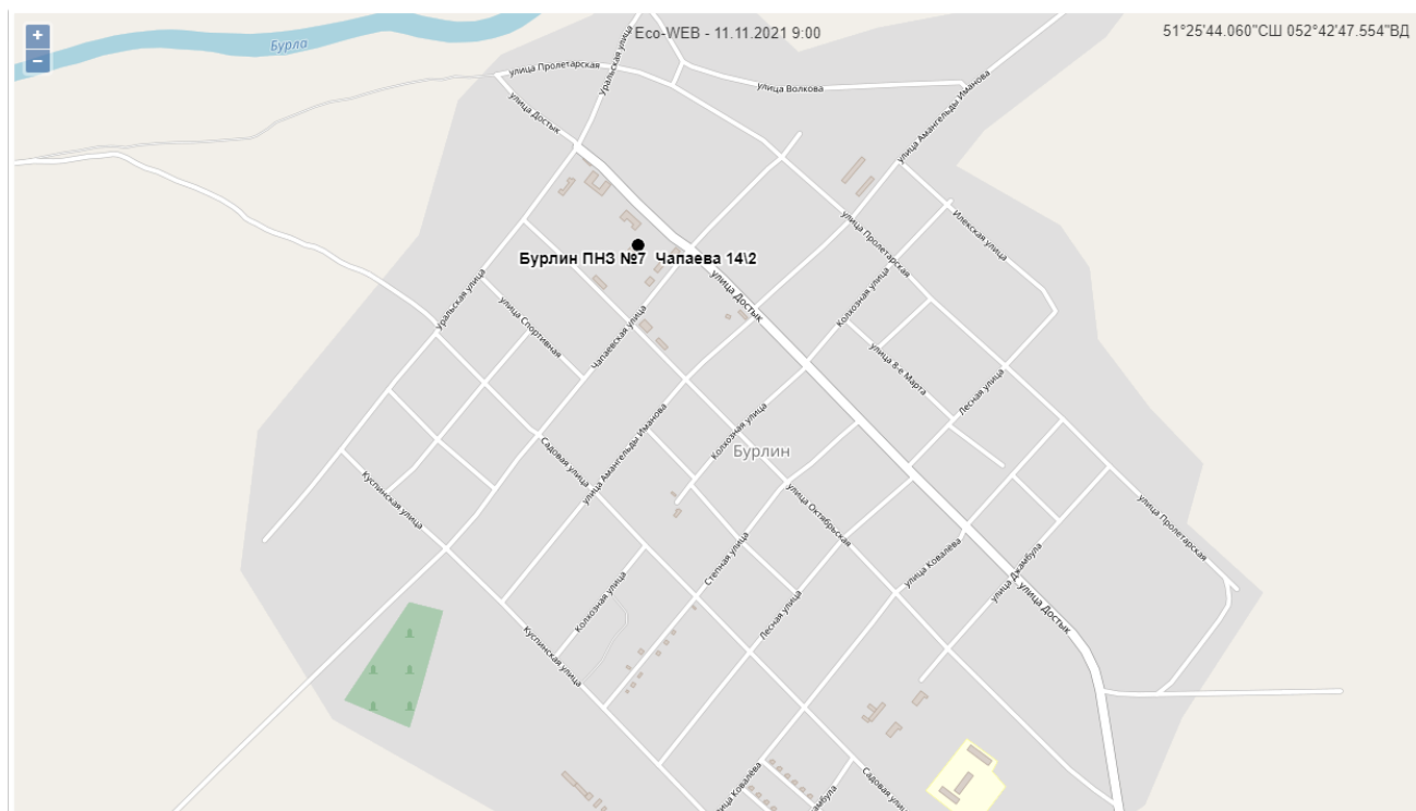
Рис.3 – карта мест расположения поста наблюдения п. Бурлин