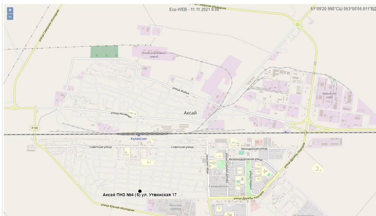
Рис.2 – карта мест расположения поста наблюдения г. Аксай