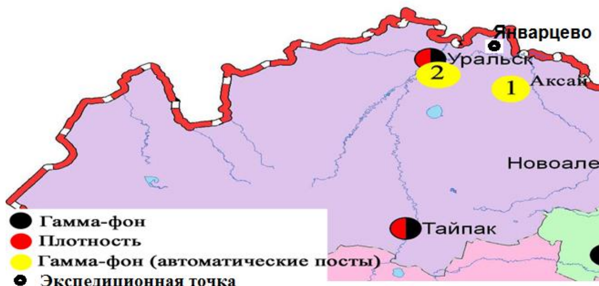
Рис. 1 Схема расположения метеостанций за наблюдением уровня радиационного гамма-фона и плотности радиоактивных выпадений на территории Западно-Казахстанской области