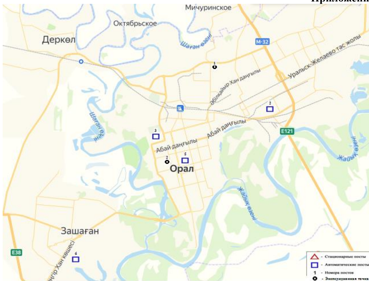
Карта мест расположения постов наблюдения, экспедиционных точек г. Уральск