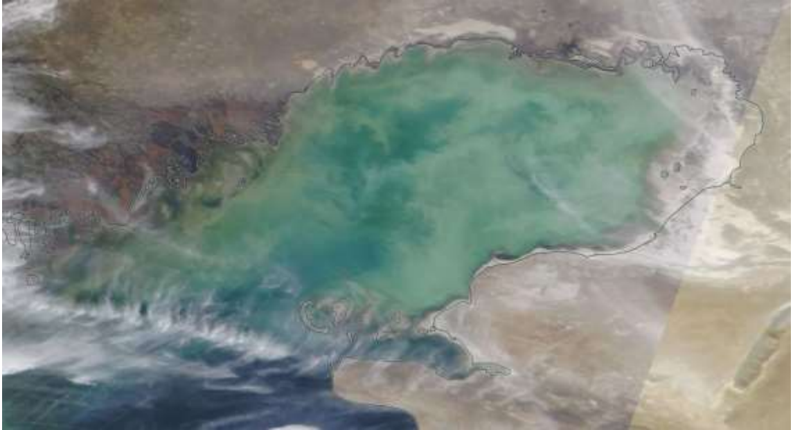
1-сурет. 2023 ж. 27 наурыз ғарыштан түсірілген Каспий теңізінің NAGA/GSFC фотосуреті