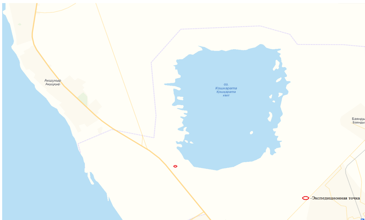
4 сурет – Қошқар-Ата қ/қ экспедициялық нүктелерінің орналасу орындарының картасы