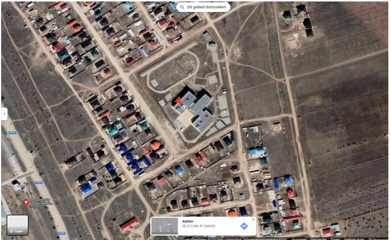
Ясныйдағы іріктеу нүктесінің орналасу картасы