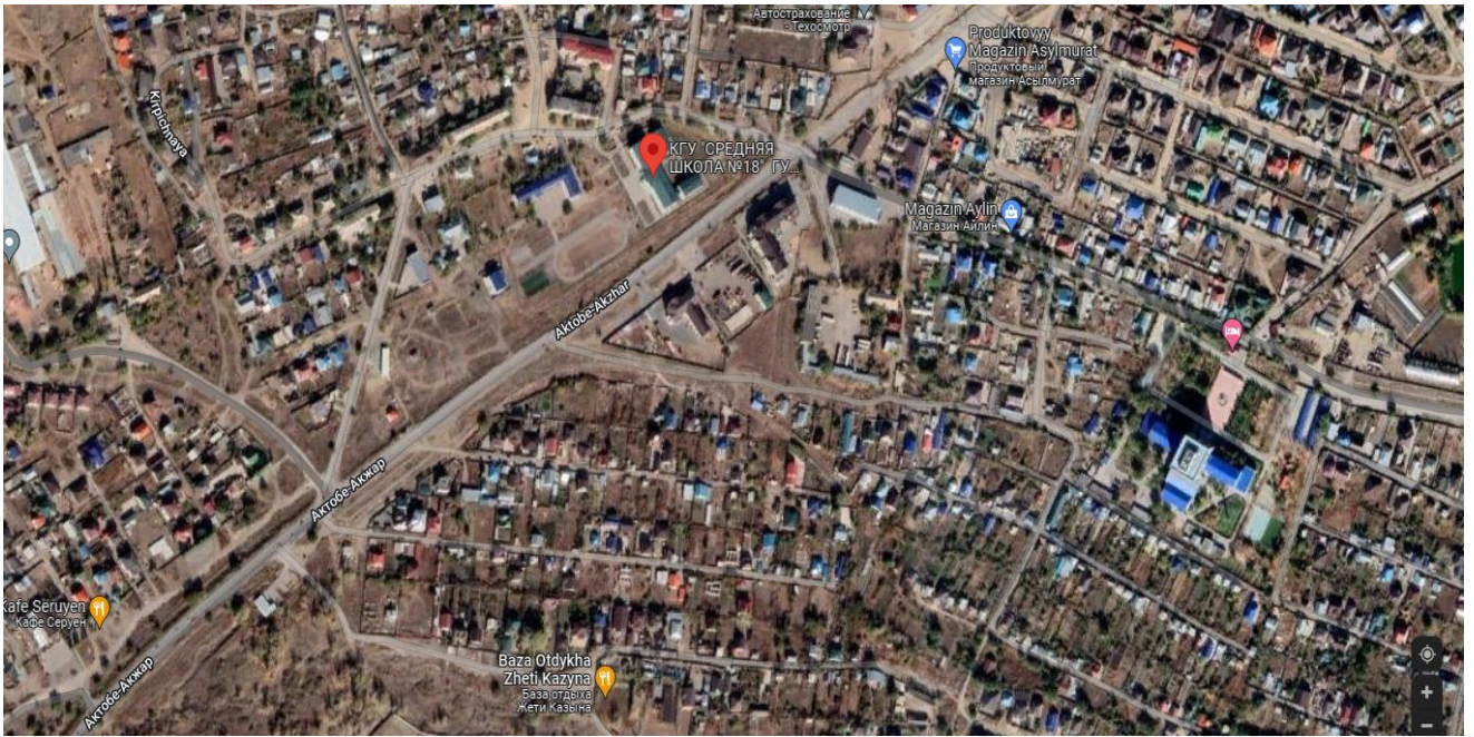
Қірпіштідегі іріктеу нүктесінің орналасу картасы