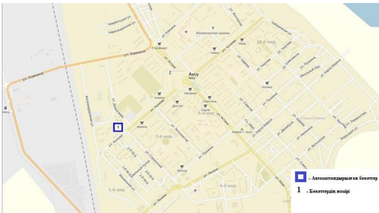
3-сурет. Ақсу қаласының атмосфералық ауаластануын бақылау стационарлық желісінің орнала сусызбасы.