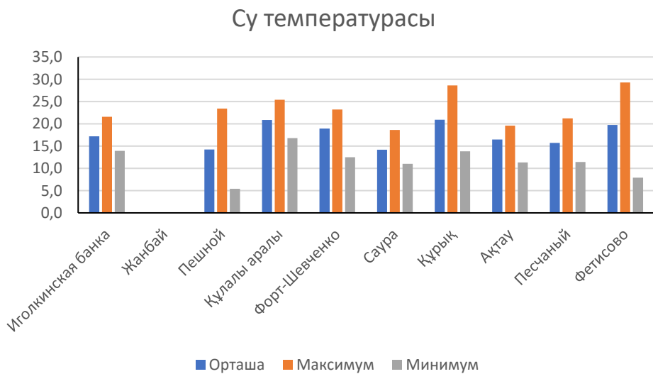
Сур.2. Су температурасы, °C