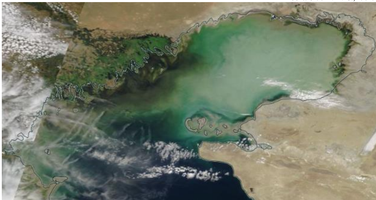
Рис.1 Космический снимок Каспийского моря, 04 июня, 2026 г.