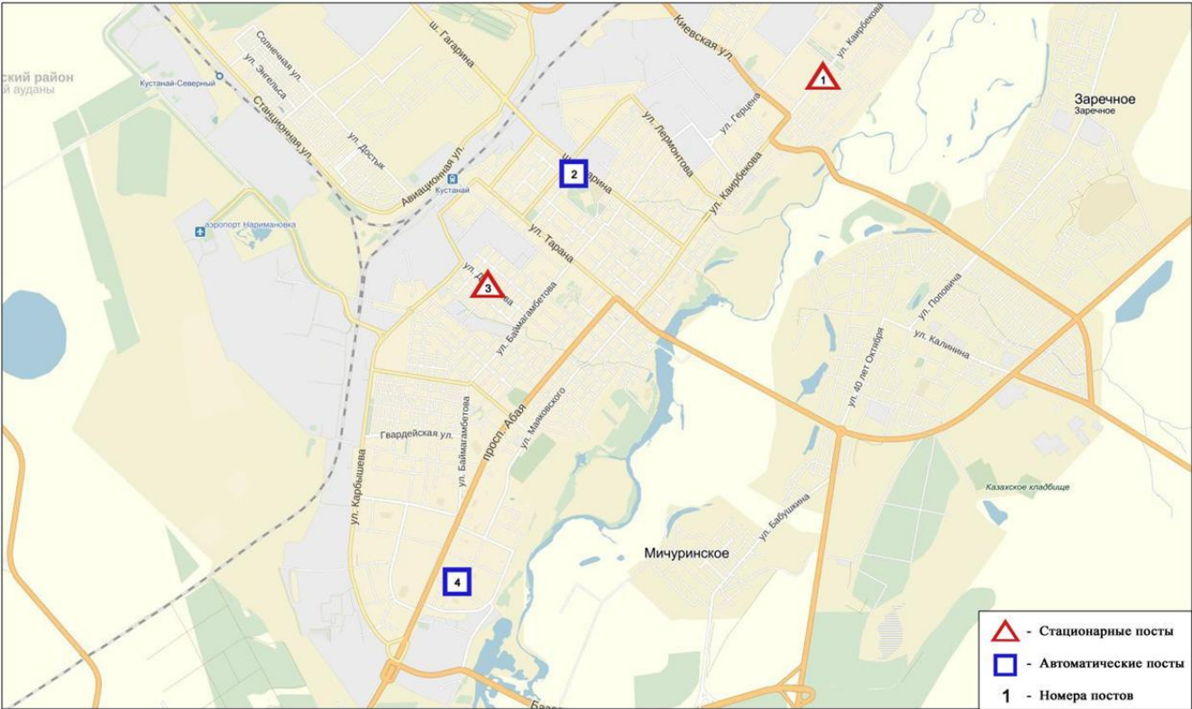
Схема расположения стационарной сети наблюдения за загрязнением атмосферного воздуха города Костанай