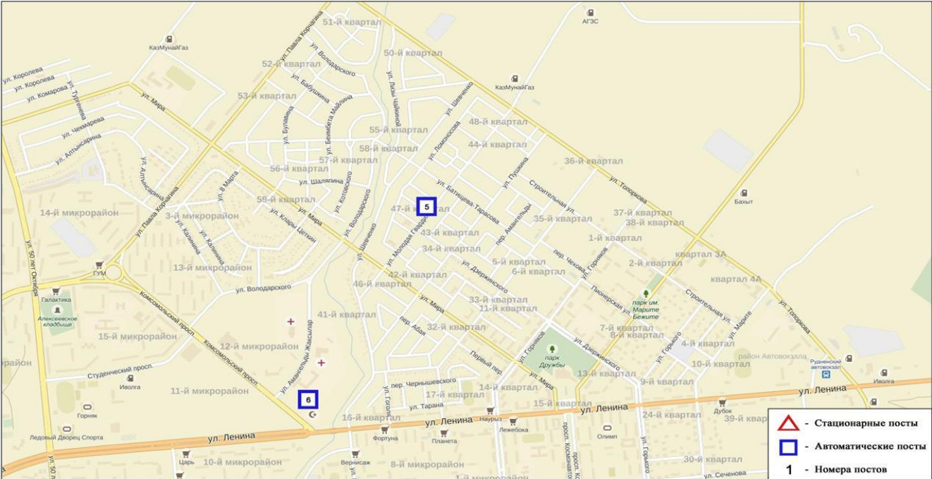
Схема расположения стационарной сети наблюдения за загрязнением атмосферного воздуха города Рудный