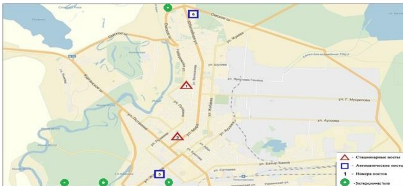
Рис.1 – Схема расположения стационарной сети наблюдения за загрязнением атмосферного воздуха СКО