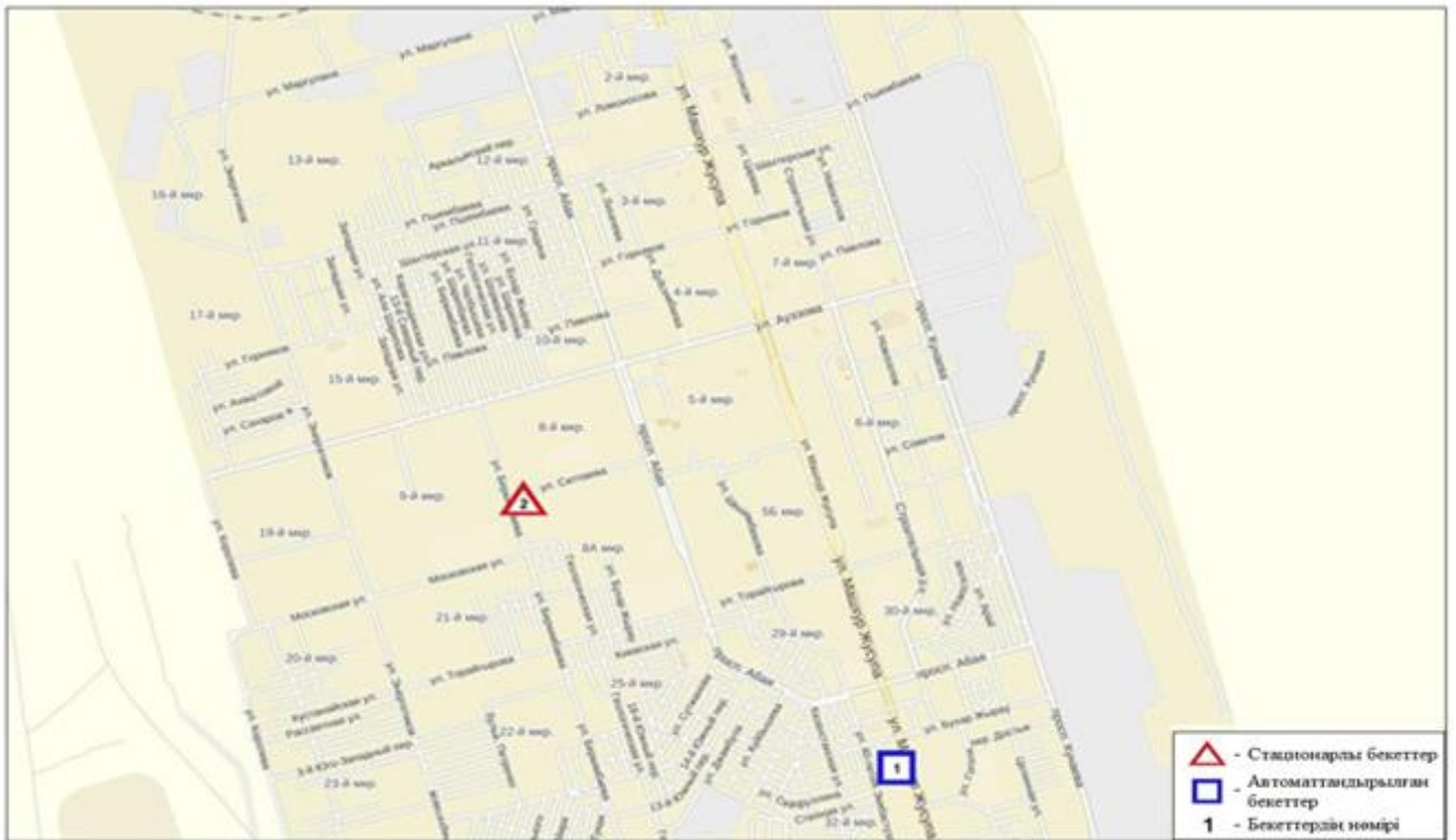
Сур.2-Екібастұз қ. бақылау бекеттерінің орналасу орындарының картасы