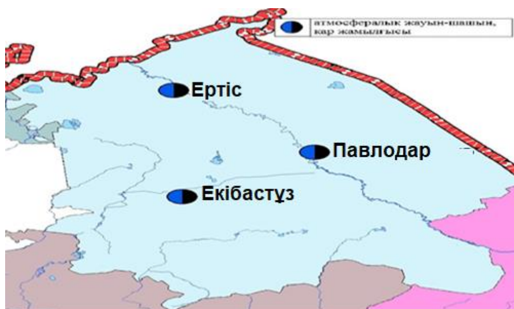
4-сурет Павлодар облысы аумағындағы атмосфералық жауын-шашын мен қар жамылғысын бақылау метеостансаларының орналасу сызбасы