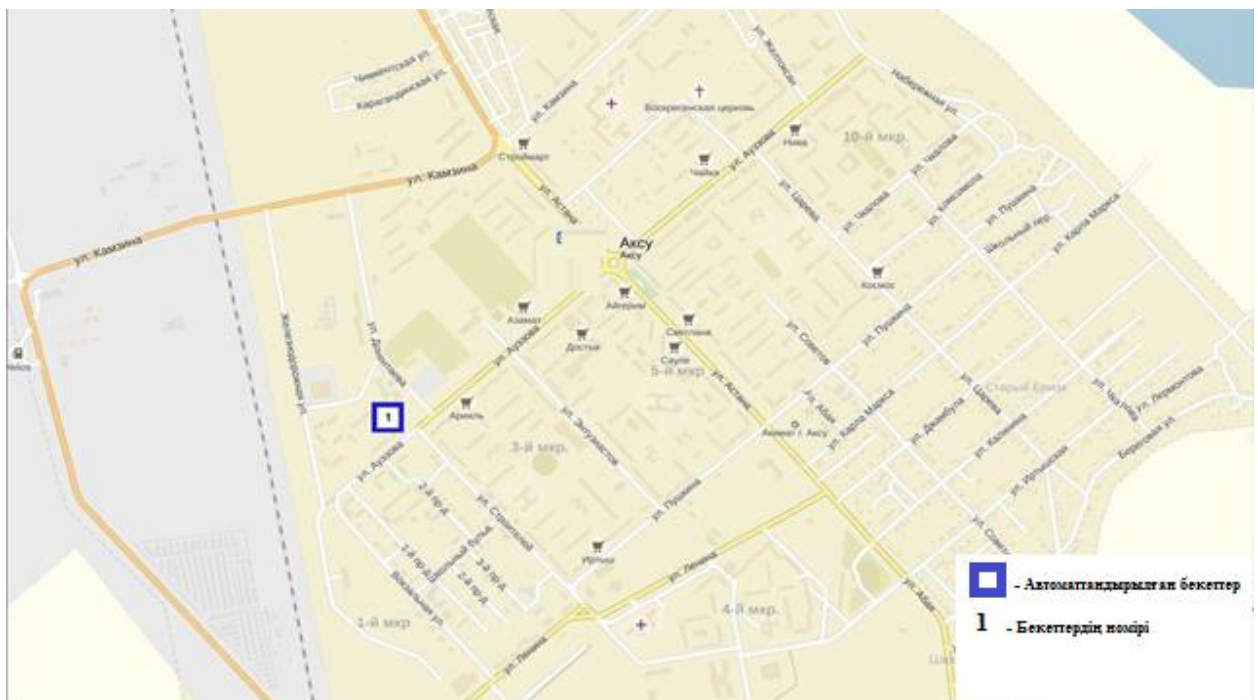
Сур.3-Ақсу қ. бақылау бекеттерінің орналасу орындарының картасы