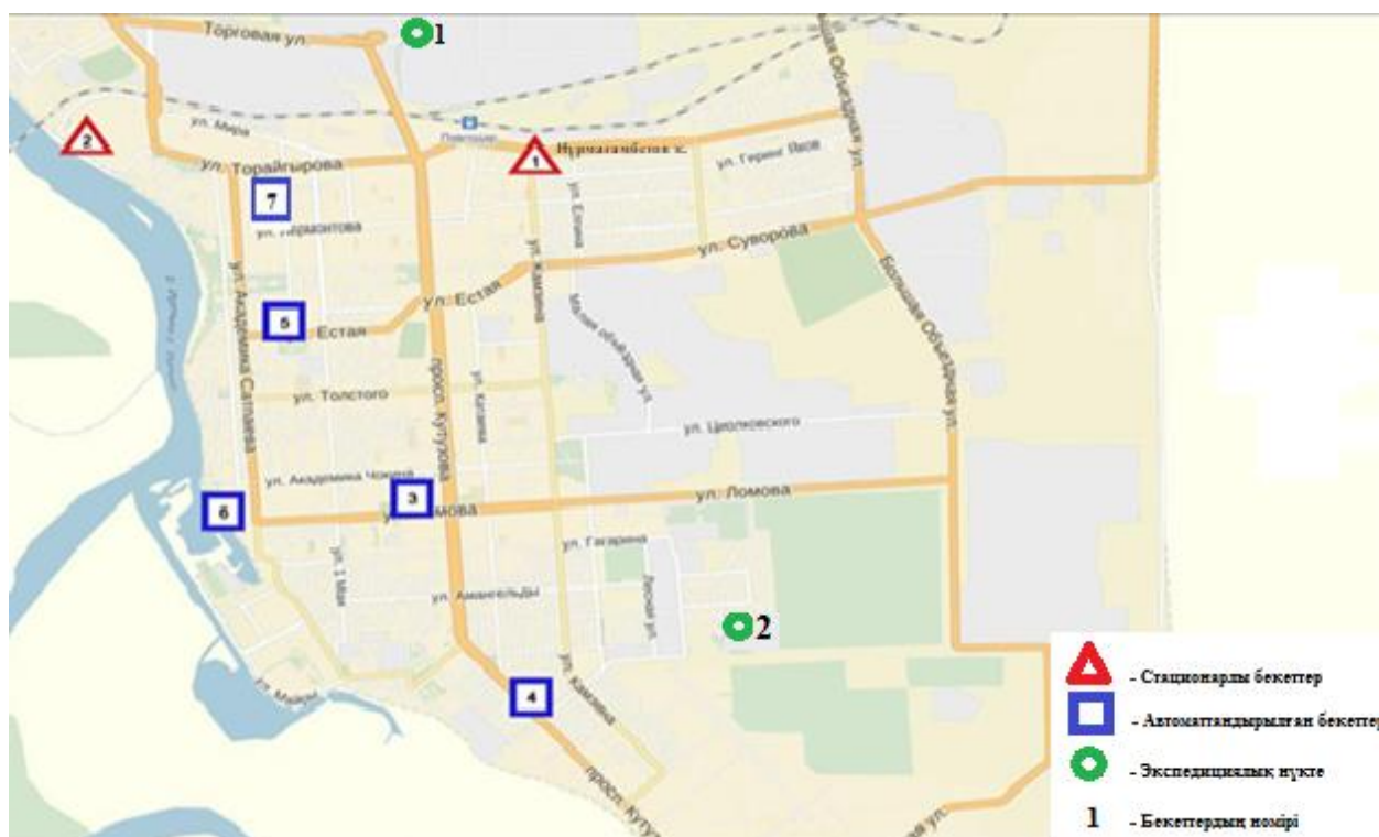
Сур.1-Бақылау бекеттері мен экспедициялық нүктелердің орналасу орындарының картасы. Павлодар