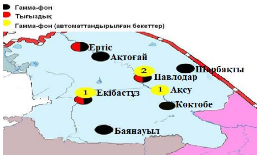
5-сурет. Павлодар облысының аумағында радиациялық фонды бақылайтын метеорологиялық станциялар орналасқан жерлердің картасы